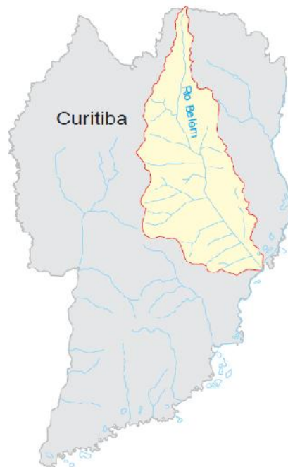
Figura 1. Localização da Bacia Hidrográfica Urbana do Rio Belém. Fonte: Fendrich (2002).

O trabalho foi realizado na Bacia Hidrográfica do Rio Belém, Figura 1, em decorrência da extrema importância deste curso d'água, cujo talvegue principal tem 21 km, encontra-se completamente inserido no Município, cortando a cidade na direção Norte-Sul, atravessando pontos importantes como parques e áreas densamente povoadas, bem como o centro da cidade. Afluente da margem direita do rio Iguaçu, o rio Belém possui cota topográfica 990m em sua nascente no Bairro Cachoeira e cota 870m, em sua foz, no Bairro Boqueirão.