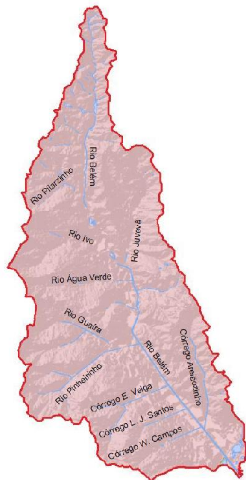
Figura 3. Bacia Hidrográfica do Rio Belém.

A construção de canais revestidos e galerias celulares em grandes extensões nos rios Pilarzinho, Ivo, Juvevê e Água Verde, e no próprio rio Belém, descaracterizaram de forma significativa estes rios. O corte de meandros, a retificação e a supressão da mata ciliar estão entre os impactos ambientais gerados nos rios e nas suas margens. O levantamento do IPPUC e da Superintendência de Desenvolvimento de Recursos Hídricos e Saneamento – SUDERHSA (2010) apresenta a hidrografia da Bacia (Figura 3) em seu estado atual, onde são visíveis as intervenções antrópicas quando observado a descontinuidade dos rios, caracterizada pela canalização de alguns trechos e o corte de meandros cedendo lugar a extensões retilíneas.